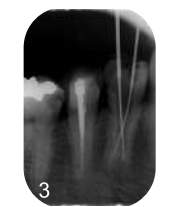
3 頬側と舌側、2つの根管内にファイルが通せている