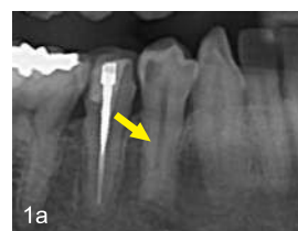
1a 初診時パノラマ：右下4番は通常の1根管にみえる