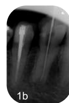
1b デンタル画像で根管の形態に違和感を感じた