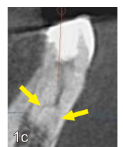
1c CTの頬舌の断面：根が分岐していることが分かる

根管に見えますよね（図1a）。ところがデンタルを撮影すると、通常の1根管の形態をしていないことに違和感を感じました（図1b）。なんかおかしいと思ってCT撮影をしてみると、根管が途中で枝分かれして根尖がふたつあることがわかりました（図1c）。そこで両根管の根尖まで確実に処置ができるよう、治療戦略を立てました。アプローチの難しそうな舌側の根尖にもアプローチできるように、まず湾曲部まで根管を最小限削除（図2：水色部分）し、それから両根管を処置することになりました。